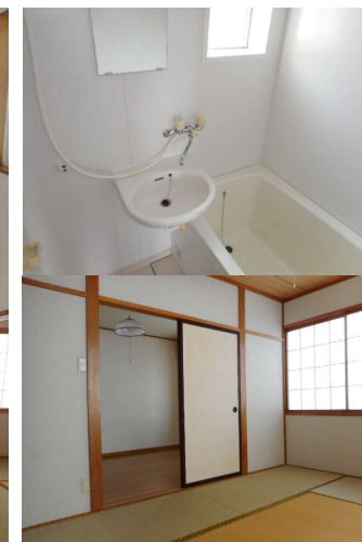
内覧写真は別部屋のものです。