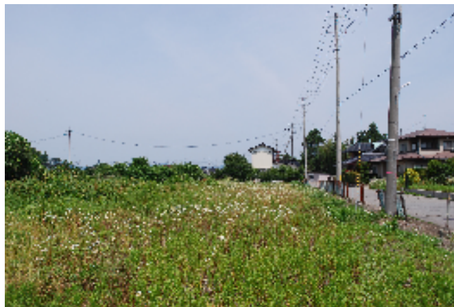
図面と現況に相違がある場合は、現況優先と致します。